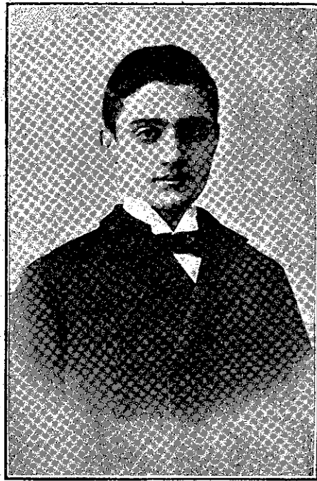
ΑΝΑΠΡΕΙΟΣ ΕΥΖΩΝΟΣ (Μεσαία Τάξις)

Τόσον μικρά ή καϊμένη ή Μηλιά, και όμως έπρεπε να συλλογίζεται και να προβλέπη τα πάντα, να αποφασίζει χωρίς γονείς δια να την συμβουλεύουν, χωρίς κανένα δια να την βοηθή και να την προστατεύη! Άλλ' είχε γενναίαν ψυχήν, όπως σας είπα. Μετά το λιτότατον δείπνον, έβαλε τον αδελφόν της να κοι-